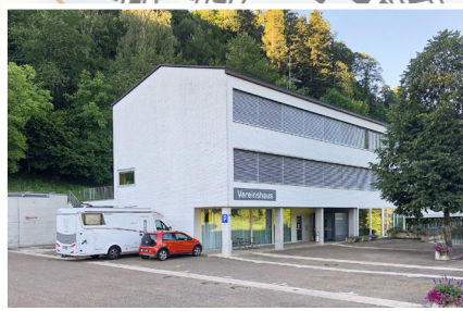
Vereinshaus Haldenstrasse 86