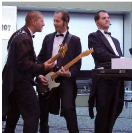
Volksmusikanten» - ebenfalls aus Ruggell - ein weiteres Highlight angesagt.

Die Partyband «Wurscht`n`Brot» ist im April 1994 aus zwei Garagen- und Waschaumbands entstanden und sorgt mittlerweile seit 13 Jahren im In- und Ausland für absolute Top-Unterhal-