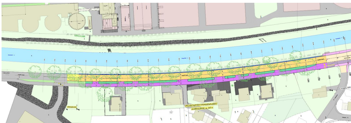
Projekt-Perimeter: Situation Strassenbau

Das Land setzt den Strassenausbau, inklusive Ausbau von Fuss- und Radweg auf 3.00 m, analog den vorhergehenden Etappen um.